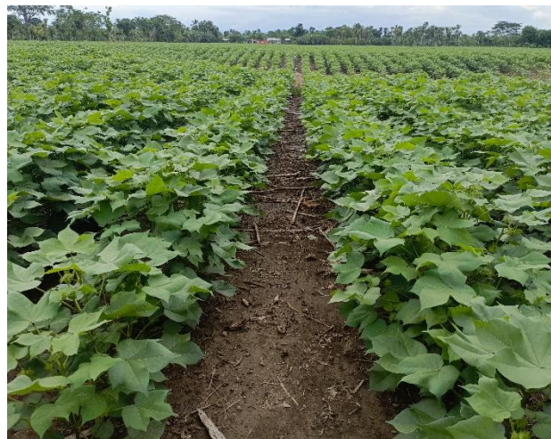
Imagen N°1: Cultivo de algodón, inicio de floración. Municipio de Cereté, Córdoba

algodonera 2.024/25 están participando 15 empresas algodoneras en la producción de fibra de algodón, de las cuales 10 de ellas han firmado contratos con Diagonal hasta la presente fecha por 1.792 toneladas de fibra, con las empresas que falta por firmar contratos se estima que la comercialización total en el departamento de Córdoba esté cercano a las 2.624 toneladas. La empresa productora de la semilla de algodón, BASF, a través de su distribuidor Diabonos, ofrecieron cinco variedades transgénicas, los agricultores mostraron preferencia por las variedades FM974GLT y FM911GLTP, en total, Diabonos pudo vender 10.450 Kg de semilla (900 hectáreas aproximadamente).