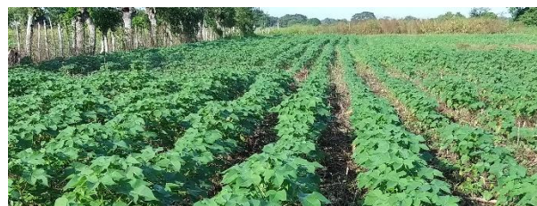
Imagen N°1: Cultivo de algodón, etapa vegetativa. Municipio de Cereté, Córdoba

Estas cifras indican que los productores han decidido por la siembra de las variedades más nuevas en el mercado, como son las FM974GLT, FM911GLTP y FM944GL. La red de monitoreo de picudo supervisada por el FFA, reporta una disminución en las capturas comparando con la quincena anterior, pasando de 4,3 picudos adultos promedio/trampa a 2 picudos/trampa, y cero capturas de picudos rojos (jóvenes).