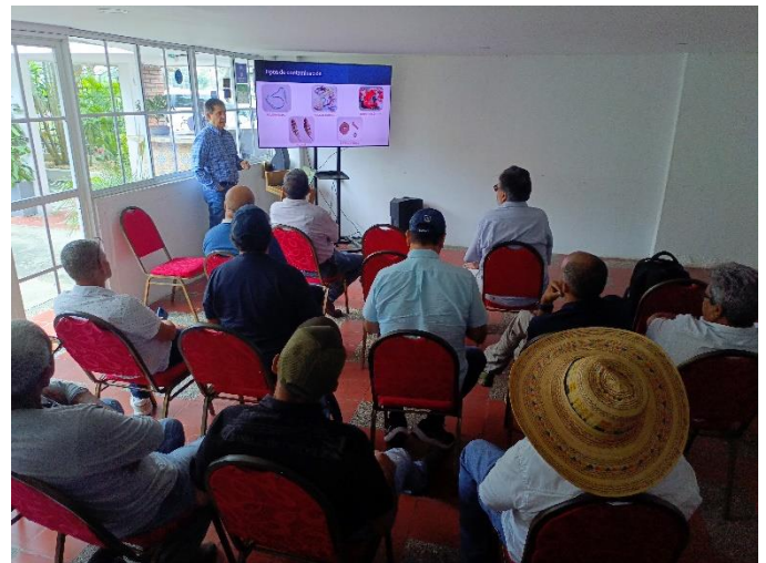
Imagen N°4: Reunión con empresarios algodoneros para tratar los temas de comercialización y contaminación de la fibra de algodón.

en poner varias personas en la máquina de apertura, esto tiene la ventaja de que no hay que prensar ni poner nuevamente tela y zunchos, pero es peligroso porque la máquina está en constante movimiento, las fábricas ya no aceptan realizar más este proceso. Diagonal propone hacer un control en la desmotadora, que consiste en disponer el algodón semilla en una banda transportadora, en la cual varias personas revisan el algodón antes de entra al proceso de desmote, este sistema se implementó en África, y con él se logró certificar el algodón como libre de contaminación, este sería el sistema más apropiado si las campañas contra la contaminación no funcionan.