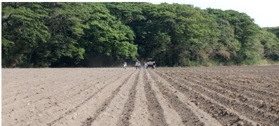
Figura 2. Recolección manual de residuos de cosecha Armero-Tolima