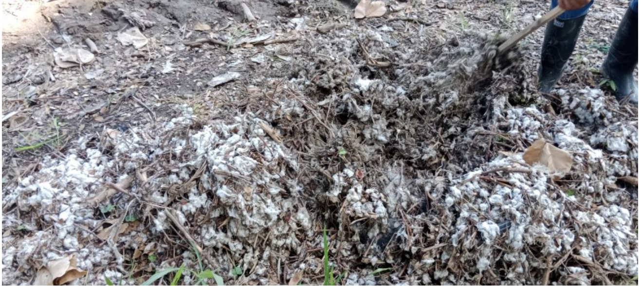
Figura 3. Residuos de cosecha a ser quemados por ser foco de picudo.