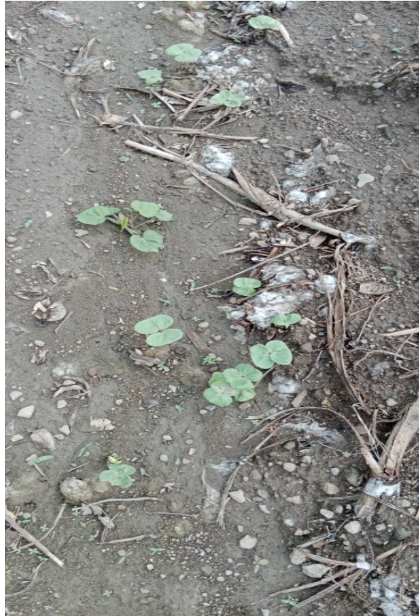
Figura 1. Residuos de cosecha y rebrotes de algodón Armero-Tolima.