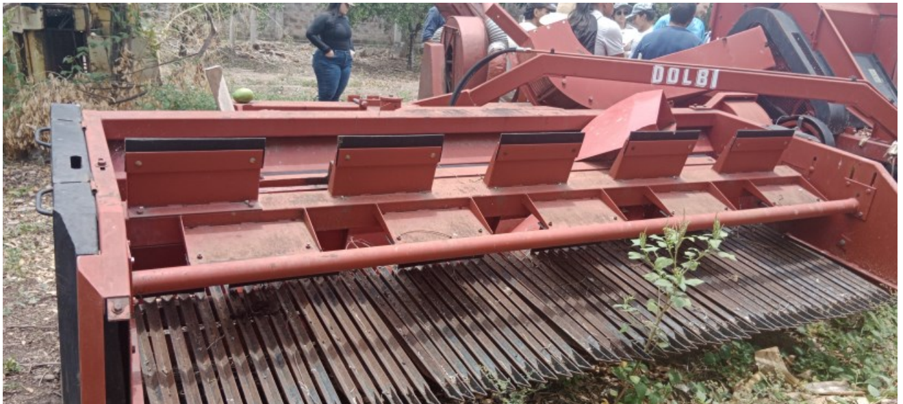
Figura 4. cosechadora tipo striper Javiyu para algodones adensados Ambalema-Tolima.