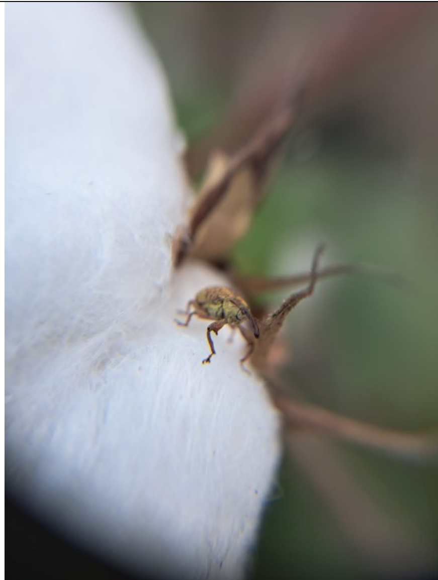
Figura 8. Afectación por larva de picudo Espinal-Tolima

información estratégica para el manejo integrado del picudo, plagas y enfermedades del cultivo del algodón para el año 2024. Lo anterior mediante la instalación de trampas, realización de monitoreo quincenal de la presencia del picudo algodouero del y manejo del material etológico en las regiones descritas en el objeto del presente contrato.